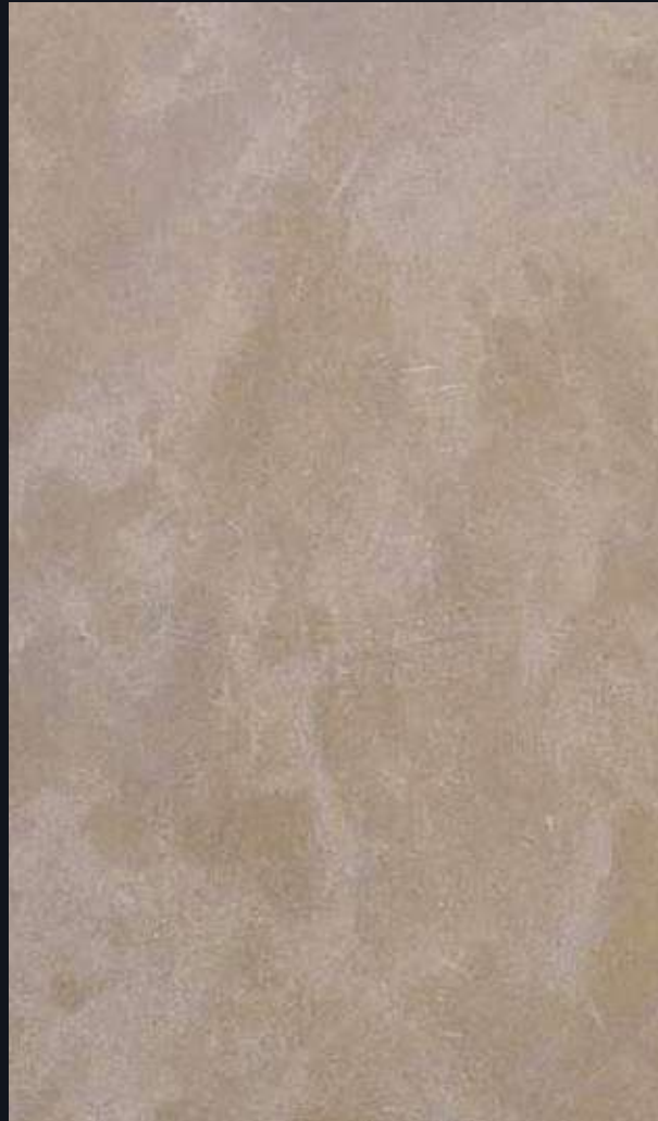
Pierre de taza Beige polli

La Pierre de Taza Beige Poli est un marbre élégant, extrait des carrières du Maroc, reconnu pour sa teinte beige naturelle et sa finition polie.