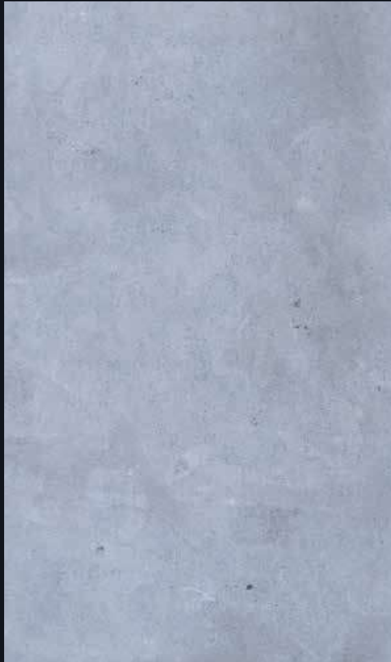
Pierre de taza Gris polli

La Pierre de Taza Gris Poli est un marbre raffiné provenant du Maroc, prisé pour sa surface lisse et son éclat brillant.