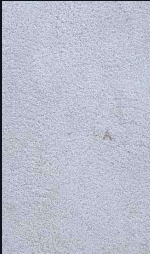
Pierre de taza Beige Bouchardé

La Pierre de Taza Beige Bouchardé est une pierre naturelle remarquable, provenant de la région de Taza au Maroc. Ce marbre beige, avec sa finition bouchardée, se distingue par sa surface texturée et son apparence robuste, tout en conservant une élégance naturelle.