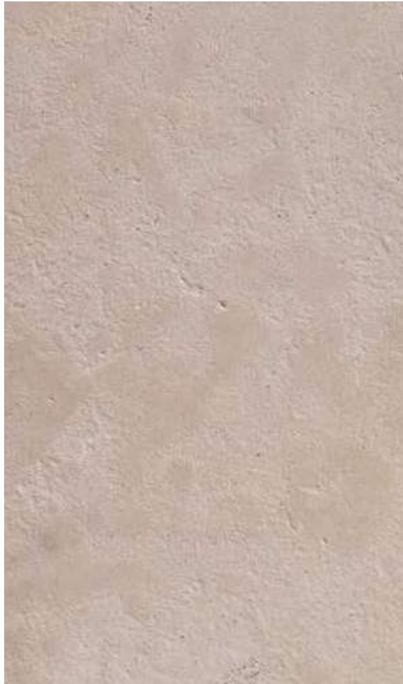
Pierre de taza Beige vieillie

La Pierre de Taza Beige Vieillie est une pierre naturelle exquise, provenant du Maroc, connue pour sa teinte beige douce et sa finition vieillie.