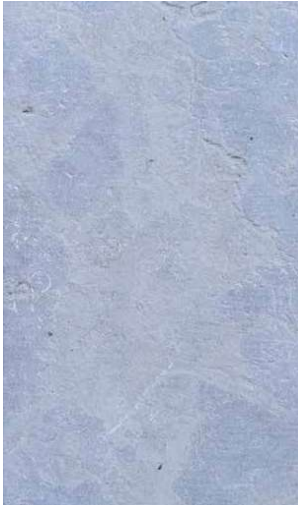
Pierre de taza Griz vieillie

La Pierre de Taza Gris Vieille est une pierre naturelle raffinée, issue des carrières du Maroc, qui se distingue par son aspect vieilli et patiné.