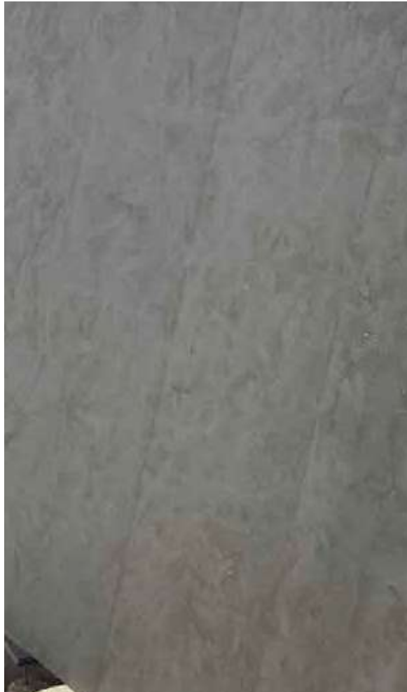
Pierre de taza Gris Brut

La Pierre de Taza Gris Brut est une pierre naturelle de qualité supérieure, issue de la région de Taza au Maroc. Avec sa teinte beige neutre et sa finition brute, ce marbre offre un aspect brut et authentique qui met en valeur la beauté naturelle du matériau.