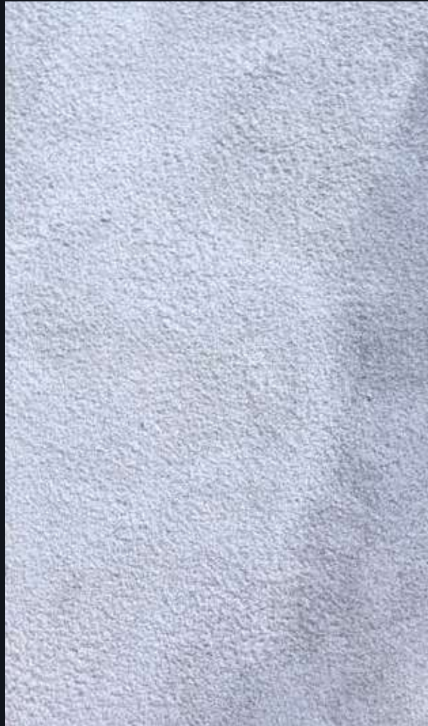
Pierre de taza Gris Bouchardé

La Pierre de Taza Gris Bouchardé est un marbre d'exception, originaire du Maroc, apprécié pour son esthétique brute et sa robustesse.