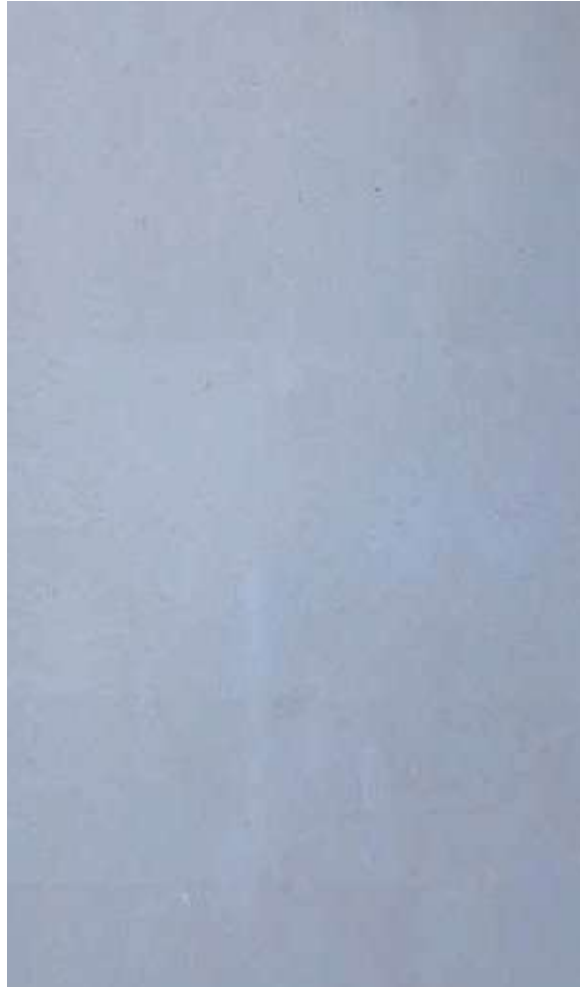
Pierre de taza Beige brut

La Pierre de Taza Beige Brut est une pierre naturelle de qualité supérieure, issue de la région de Taza au Maroc. Avec sa teinte beige neutre et sa finition brute, ce marbre offre un aspect brut et authentique qui met en valeur la beauté naturelle du matériau.